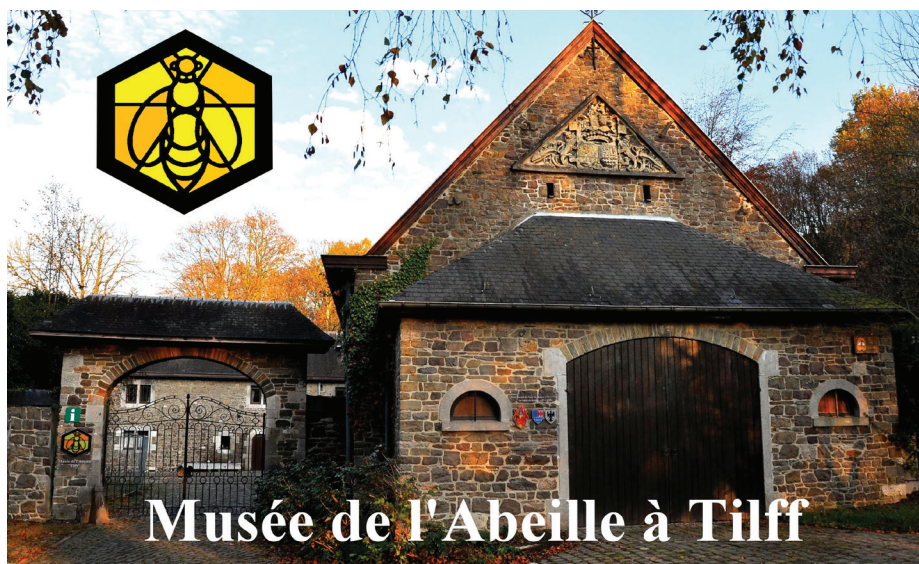
Musée de l'Abeille à Tilff

Nous vous recevrons volontiers les samedis, dimanches et jours fériés d'avril, mai, juin et septembre de 14 h à 18 h et tous les jours en juillet et août de 10 h à 12 h et de 14 h à 18 h. Entrée adultes 3.50 €, enfants de moins 12 ans 2.50 €. Possibilité d'une visite guidée pour des groupes de 15 personnes. Esplanade de l'Abeille, 11 à Tilff. Tél : 0479.66.55.23